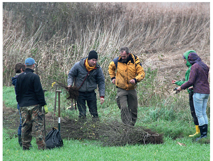
Heckenpflanzung durch Mitarbeiter und ehrenamtliche Unterstützer der Stiftung.

MICHAEL SUCCOW STIFTUNG zum Schutz der Natur