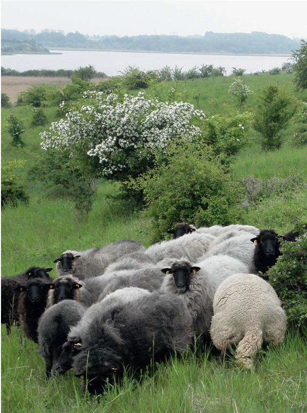
Pommersche Rauhwollige Landschaft auf Melow.