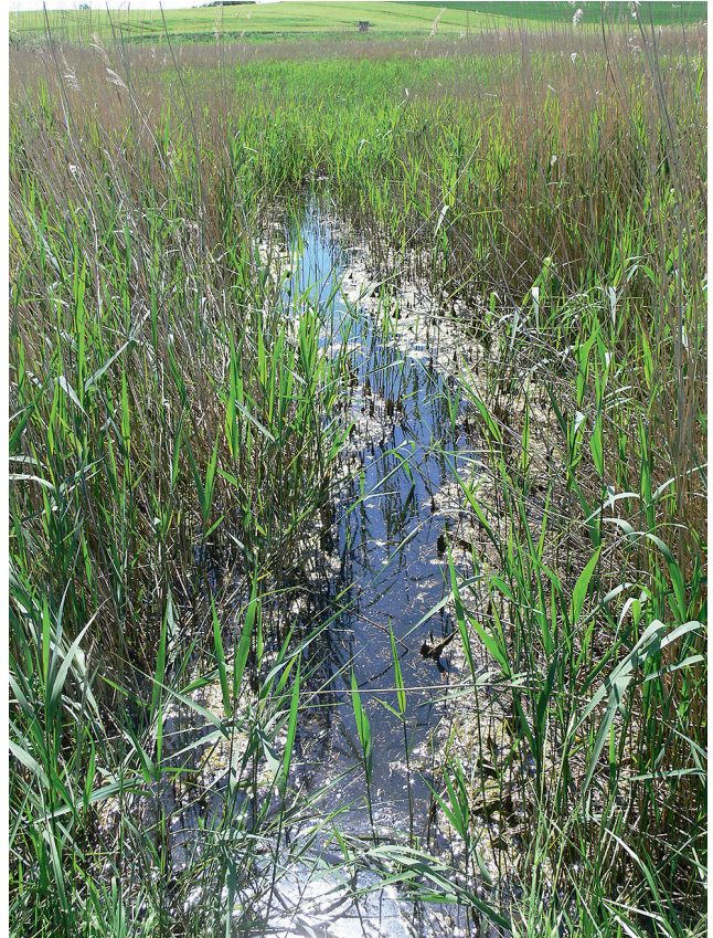
Wiedervernässte Moorniederung mit angestautem Entwässerungsgraben.